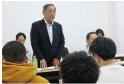
挨拶する長門組合長