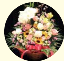
ステージを飾った盛り花