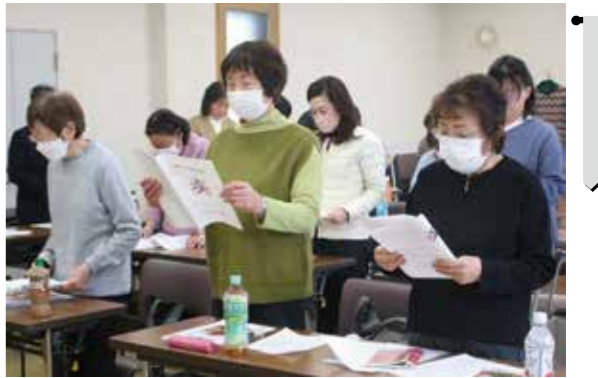
綱領を読む部会員