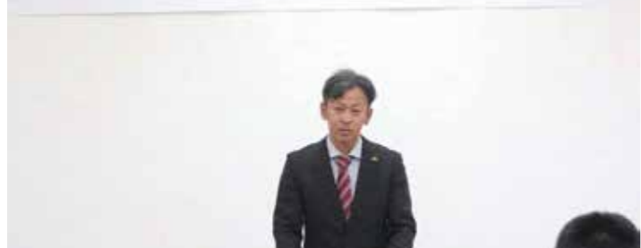
挨拶する鎌田組合長