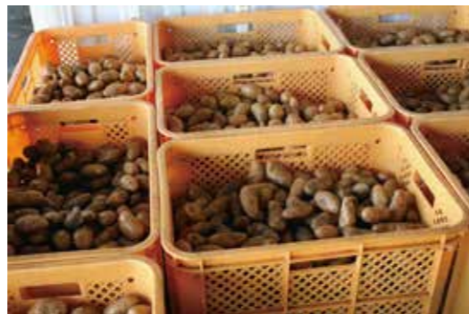
消毒済みのジャガイモ

そうか病に対しては、銅ストマイ水和剤100倍液、瞬間浸漬、アグレプト水和剤60〜100倍液、瞬間浸漬がある。