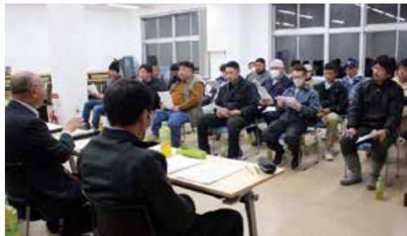
熱心に話を聞く出席組合員

JAむかわ（正組合員316名）は3月23日から3日間、集落センターとJA本部事務所地区別懇談会を開いた。懇談会では延べ63名が出席して対話を深めた。25日のJA本部事務所では、組合員21名と役員13名が出席した。