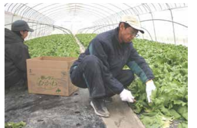
むかわ春レタスを収穫する関夫妻

レタスを皆さんに食べてもらいたい。上葉はしゃぶしゃぶなどに、中はサラダなどでシャキシャキ感とおいしさを味わってください」と話した。 4月になると65戸の生産者が収穫し、日量3000箱を全道各地に出荷し、鶴川春レタスの季節を迎える。JAむかわのレタスは15年の歳月をかけ、道産レタスの栽培技術を確立し、春レタス産地となった。平成19年度にはホクレン夢大賞「優秀賞」を受賞し、鶴川春一番の自信作となった。