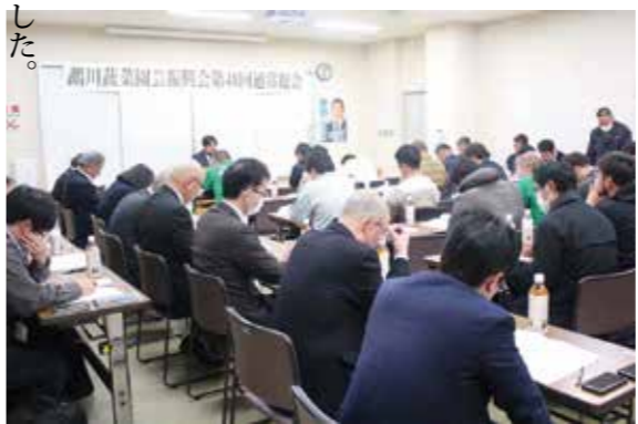
総会議案を審議する出席会員

令和8年度の活動方針では、道内外の積極的販売促進と産地交流会の実施等とともに、むかわ産ブランド力を定着させ、生産や販売体制の強化を