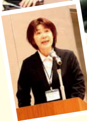
成田部長の司会はベスト