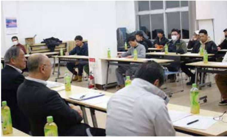
青年部と懇談する理事の皆さん