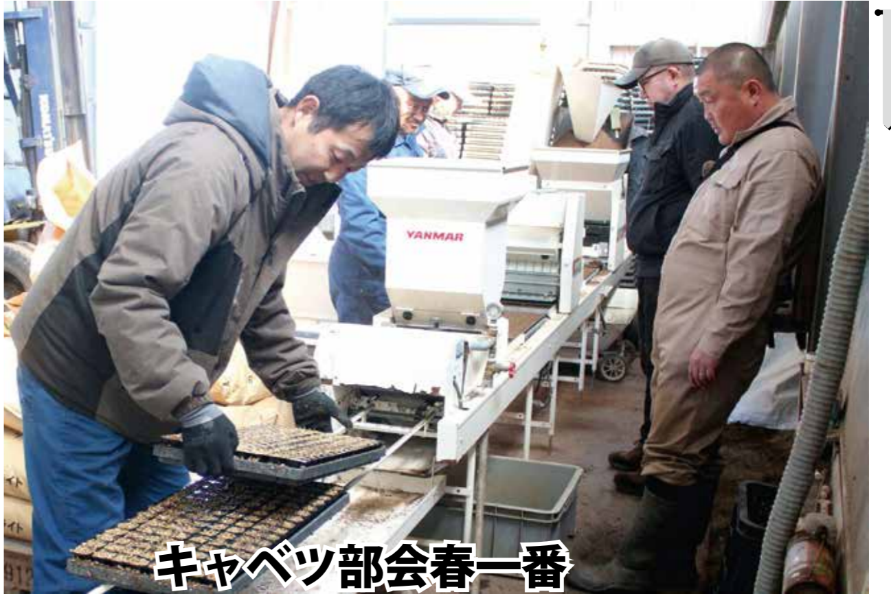
播種したパレットを確認