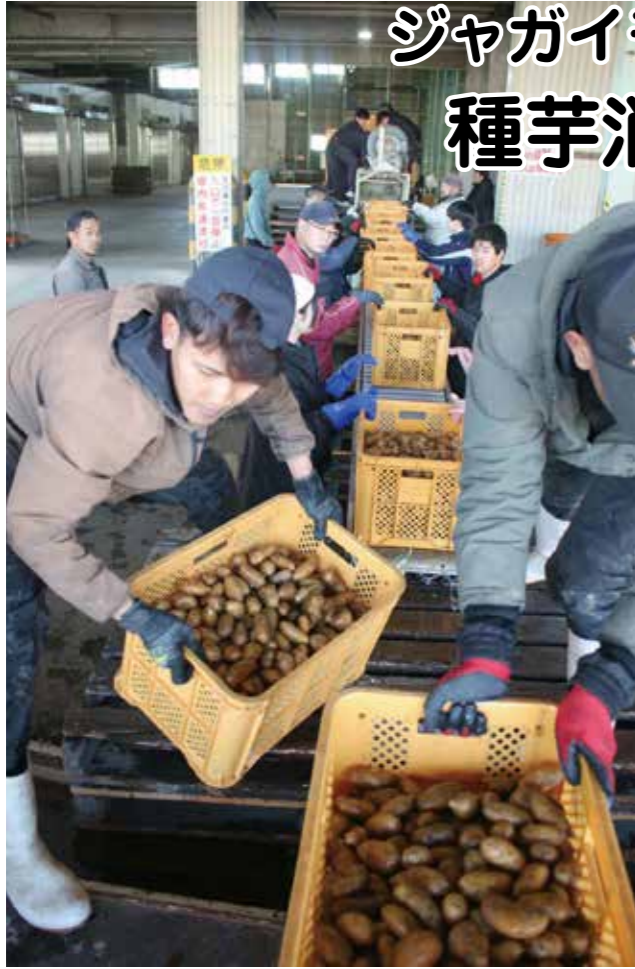
種芋の消毒をする生産者

鶴川蔬菜園芸振興会ジャガイモ部会(18名)は3月18日、JAの集出荷場前で種芋の消毒作業を行った。 早朝から消毒に備え、段ボール箱(10kg)の種芋を部会員と営農部職員が協力してコンテナ(1コンテナ20キ)に移し替えた。JA職員がコンベアに種芋入りコンテナを載せ、消毒機の水溶液に4〜5秒間くぐらせた後、流れてくる種芋を部会員らが協力してトラックの荷台に積み込む。 ジャガイモ部会では栽培に使用