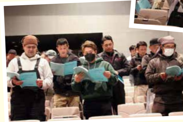
JA綱領を朗唱する組合員