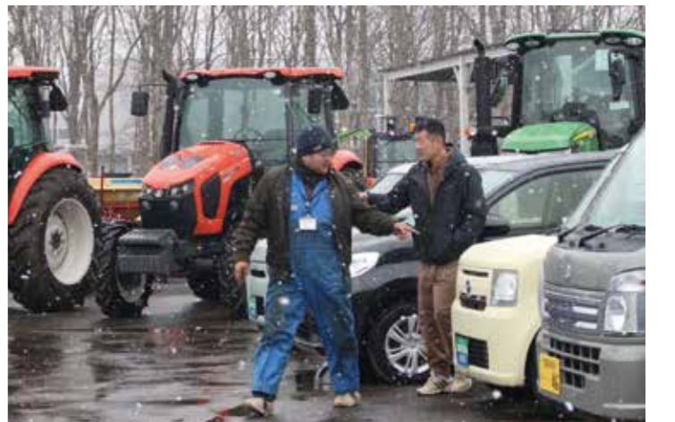
雪降る中での展示会

展示会には160名の組合員はじめ多くの来場者が訪れ、記念品がプレゼントされた。来場者は同施設の中古農機展示場の「アルダーオープンフェア」にも足を運び、勢揃いした新農業機械や中古農機具などを見て回った。また、「ディーラー協賛の新車や中古車展示コーナー」が設けられ、購入者にはJAバンクのマイカーローン最優遇金利を実施した。償還期間7年以内(正組合員)なら1.5%など、その他のローン相談にも対応した。