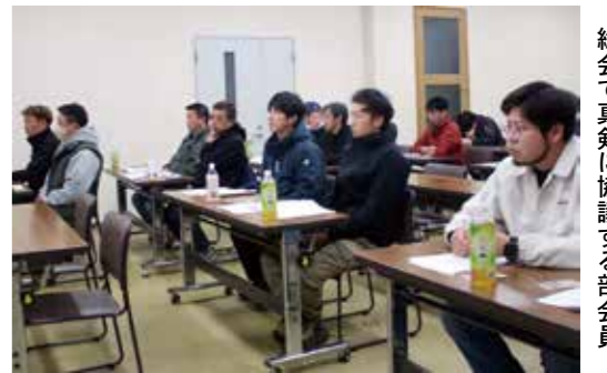
総会で真剣に協議する部会員

旅行などについて報告した。さらに一般会計収支決算報告と特別会計収支決算報告を行った。