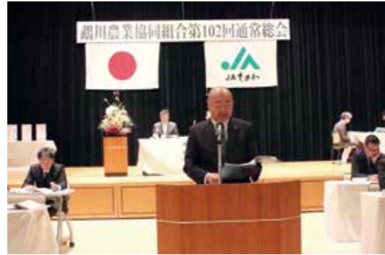
説明をする毛利参事