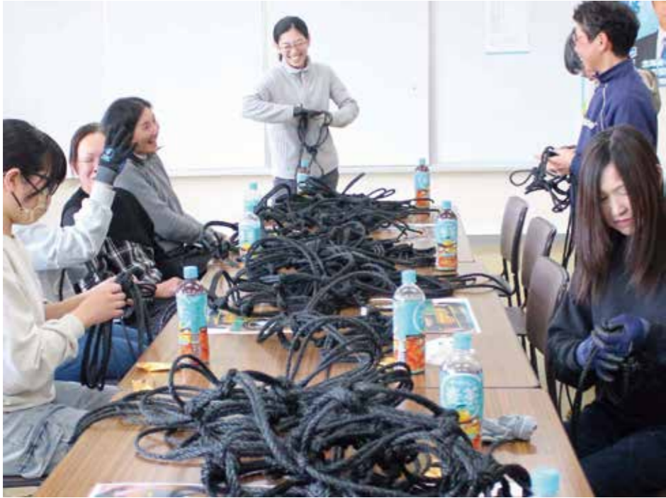
笑顔弾けるもくし作り