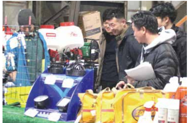
商品の説明を聞く

「2026春農業機械大展示即売会と農業資材・自動車展示即売会」を同施設構内で開いた。