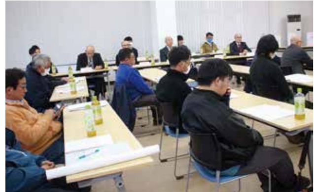
出席者と来賓の皆さん

議事の令和7年度事業経過報告では、各共進会や各枝肉共励会、毎月の市場上場用5種混合不活性ワクチン接種、削蹄、隔月の子牛登記・ヨーネ採血について報告。また、一般会計収支決算や共進会収支決算書、凍結精液会計収支決算書などを報告した。