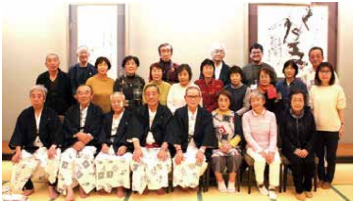
参加者みんなで集合撮影