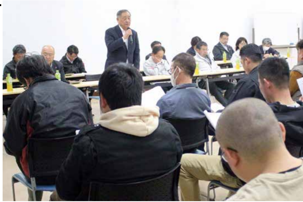
挨拶する長門組合長