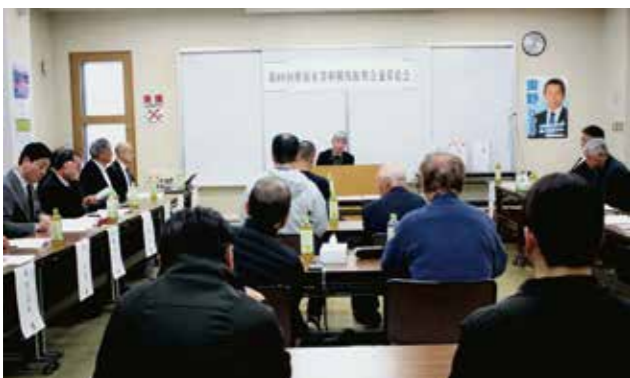
総会で審議する会員と会場

総会は、令和7年度実施した道営競馬応援視察ツアーや、馬頭観世音大祭などの事業と収支決算を報告した。