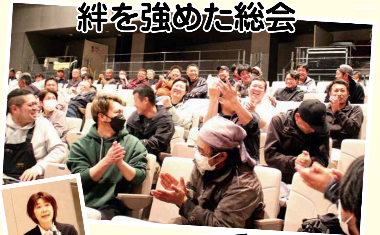
抽選が当たり会場湧く