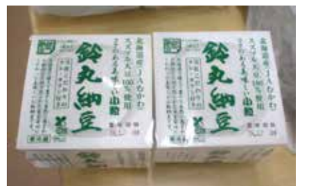
鶴川産スズマル大豆を使用した納豆

ることができました。今年も信頼に応え面積確保と栽培管理に努めていただき、今総会でご意見を賜り活動に活かしていきたい」と挨拶した。