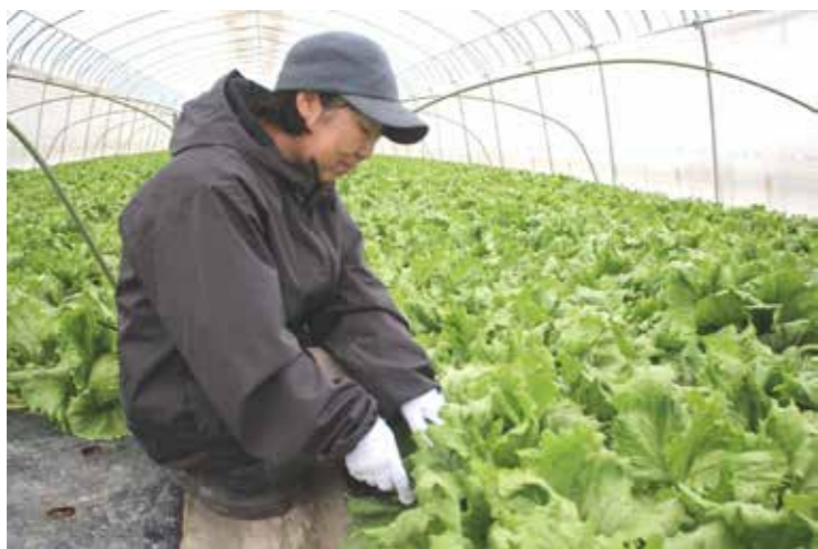
3ヶ月間育てたレタスを収穫する