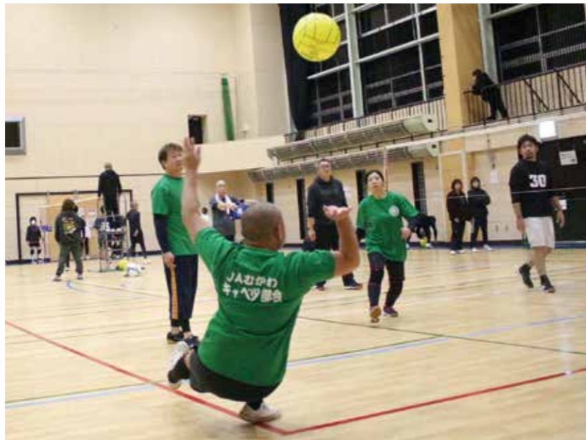
キャベツ部会のTシャツで転倒しても拾い返す