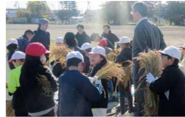
脱穀する稲束を持つ児童

殻が取れて玄米になった。さらに精米機で玄米を白米にする作業を行うと輝く白いお米になった。白米を手にした児童は「あたたかい」と声を上げた。児童は各班に分かれてこれら一連の作業を行い、作業を終えた。最後に辻部長が「田植えや稲刈り、今日の脱穀から精米になるまでを体験してお米作りの大変さがわかったと思います。おいしいご飯をたくさん食べてください」と挨拶した。最後に児童2人が「青年部の皆さんありがとうございました」と、お礼の言葉を述べた。