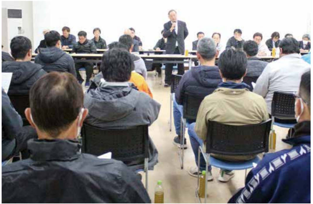
組合長の挨拶を聞く出席者