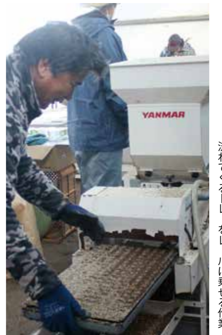
流れてくるトレイをレールに乗せる作業

レタス部会は春レタスの先駆け産地として栽培を確立し、その後も部会員がひとつになり謙虚、堅実に栽培努力を続けてきた。3月からの出荷をめざして