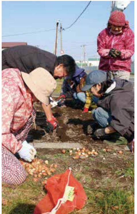
JA職員も協力しての球根植え

JAむかわ女性部は、むかわ町の姉妹都市富山県砺波市から、2018年の胆振東部地震の震災見舞いにチューリップの球根を寄贈された。以来、大切に育て、チューリップは春一番に花を咲かせてきた。来春への希望を胸に、女性部役員ら5名とJA職員が4カ所の花壇に球根植えを行った。彩りを考え、間隔や深さを一定にして、丁寧に植え付けた。