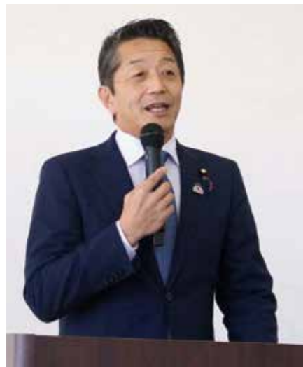
挨拶と情勢報告をする東野参議院議員

て頂きたい」とお祝いとお励みの挨拶をした。 東野議員は「500日間の選挙運動で当選させて頂き感謝とお礼を申し上げます。当選して3カ月、政局は女性初の総理大臣となり、奮闘しています。食糧自給率38%では日本の食糧を守り切れません。北海道農業の将来像をしっかりと描けるよう頑張ってください」と挨拶した。 東野議員は出席した皆さんと笑顔で握手し、今後の活躍を誓った。