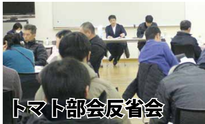
出席者と部会長ら