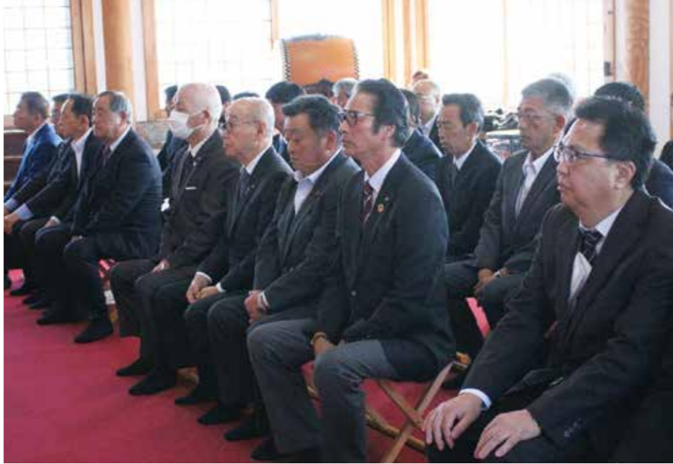
新穀感謝祭に出席の皆さん